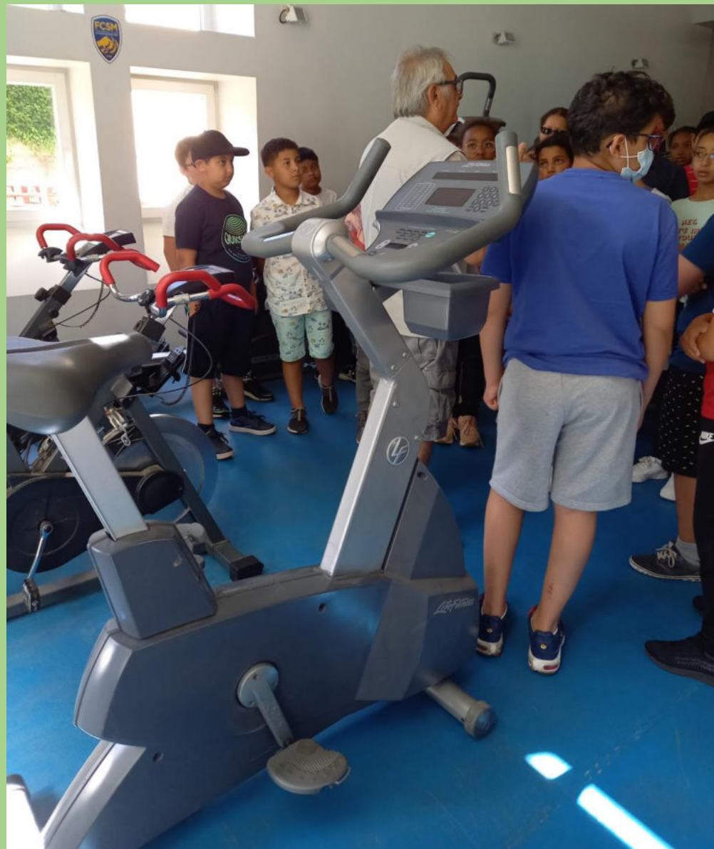
La salle de musculation