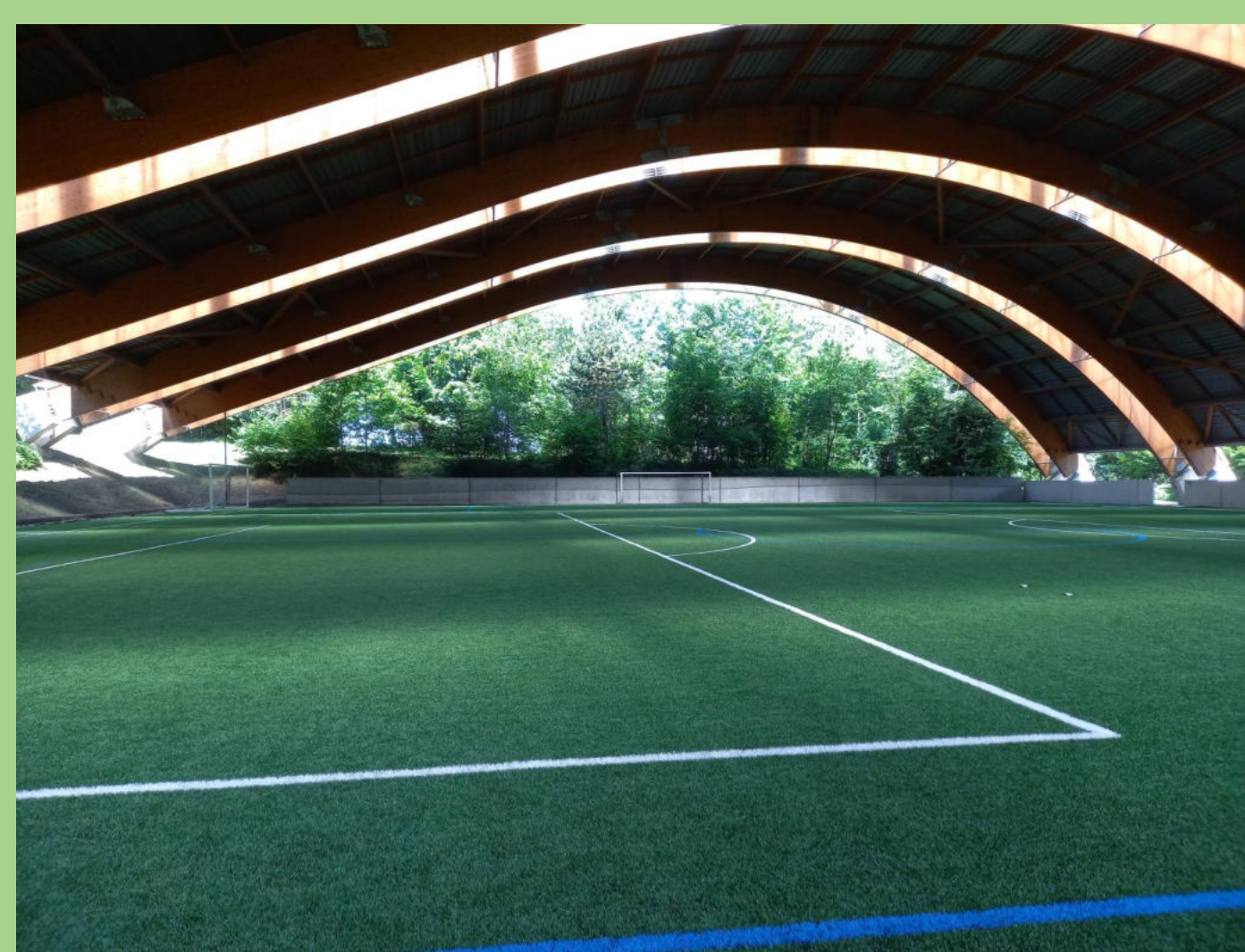
Le terrain couvert avec une pelouse synthétique

Les petits terrains pour travailler la technique