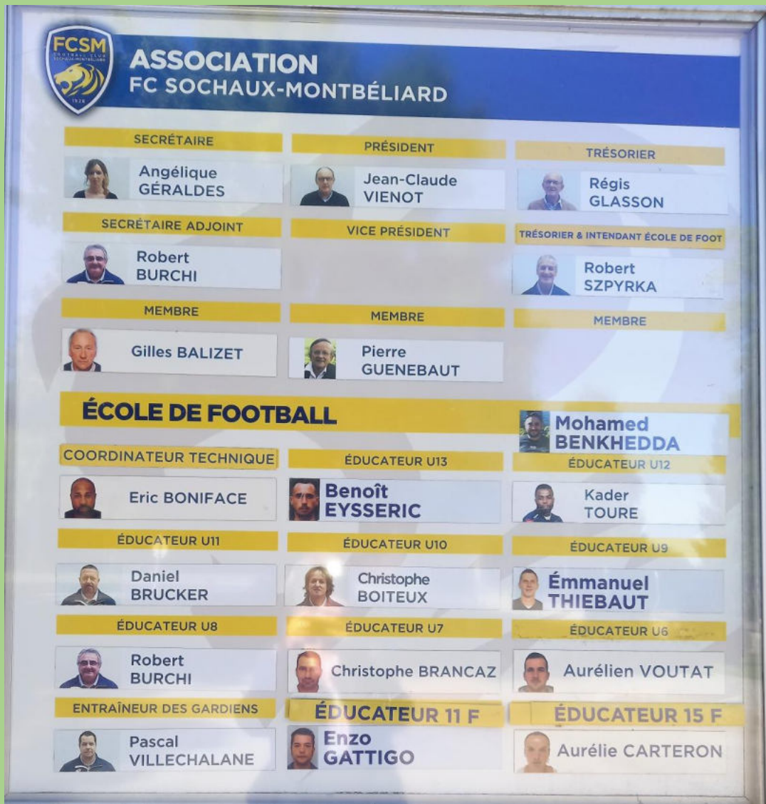
L'équipe du centre de formation