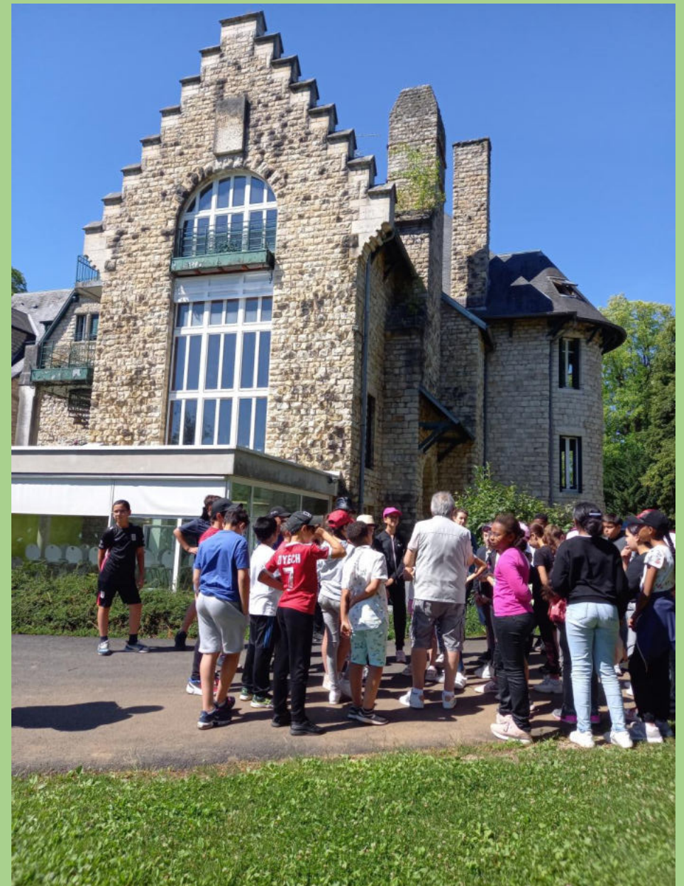
La salle de restauration