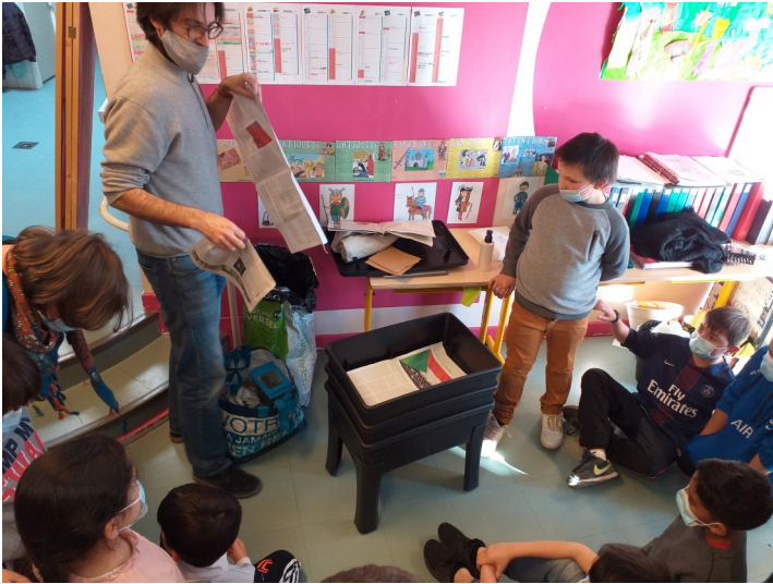
Installation du lombricomposteur et des lombrics.