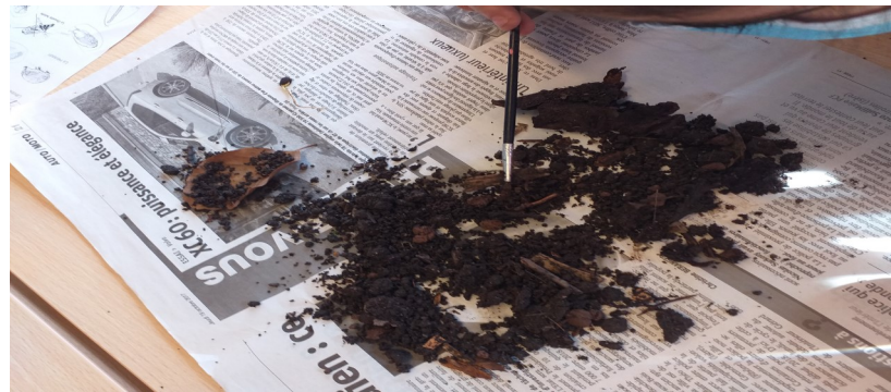
Recherche dans du compost des « petites bêtes » puis observation à la Loupe.