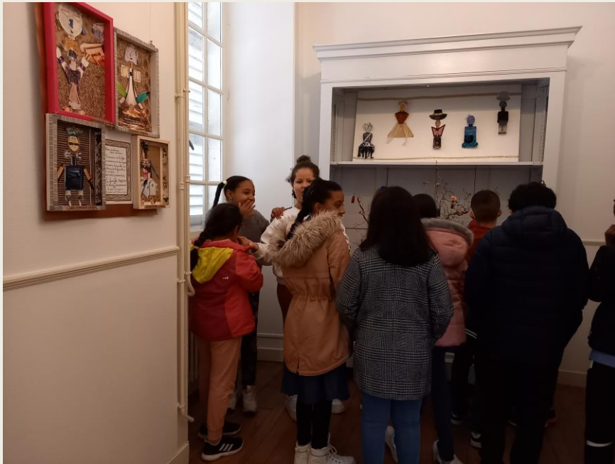
Le défilé de mode