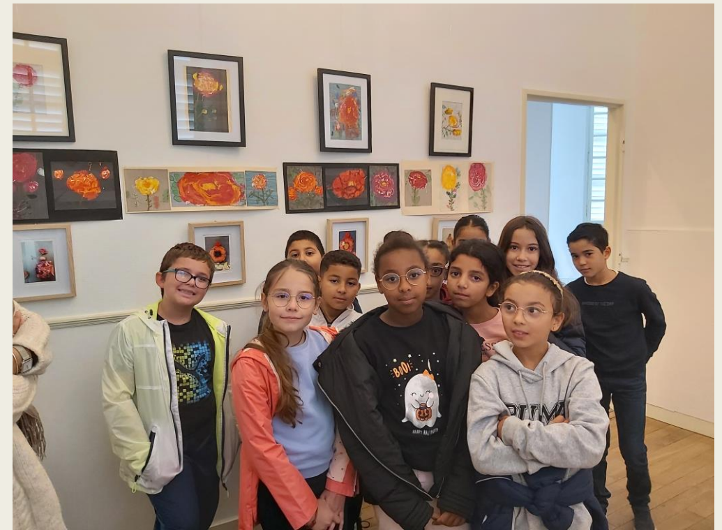
Les flacons de parfums éphémères et leurs peintures